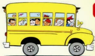
СХЕМА БЕЗОПАСНОГО МАРШРУТА ШКОЛЬНИКА